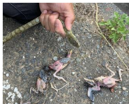
アカモズの巣で見つかったアオダイショウと襲われた雛

アカモズの卵や雛の捕食者として、新たにアオダイショウを確認しました。ネコに襲われた巣は崩されていたのに対し、アオダイショウに襲われた巣は目立った損傷がありませんでした。繁殖に失敗した巣のうち、捕食者が特定できなかった巣についても、損傷がなく卵や雛だけがいなくなっていることが多くありました。もしかしたら果樹園のアカモズにとってはアオダイショウも大きな脅威となっているのかもしれません。