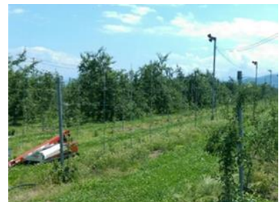
アカモズの生息する長野県のリンゴ果樹園

昨年までにアカモズの生息が確認されている中信地方と南信地方の果樹園において、引き続き生息